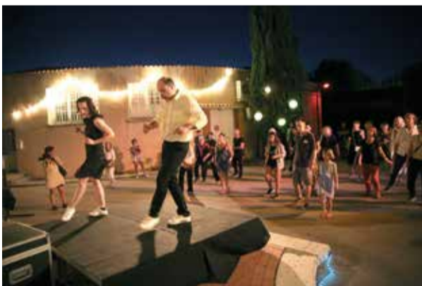
Les enfants ouvrent le bal

Imaginé par Générrik Vapeur, un bal costumé, bal masqué pour petits & grands. Les yeux ronds et les esgourdes bien ouvertes, vos « petits loups » sont invités à pénétrer dans la boîte à sons et à glisser sur le parquet du bal, jusqu'à en perdre la boule... !