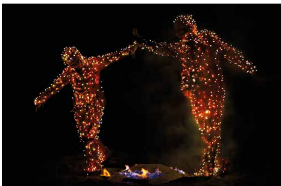
Le Grand Baiser - Groupe F

Du 14 au 18 février 2018, MP2018 Quel Amour! inaugure ses 7 mois de programmation culturelle avec 5 journées festives. Retrouvons-nous pour les Fêtes d'ouverture à Marseille et dans les villes partenaires de la manifestation : Arles, Aubagne, Istres, Martigues et Salon-de-Provence !